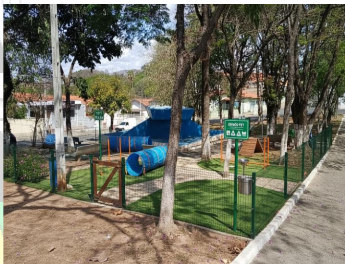
PROJETO DO ESPAÇO PET

Diante do exposto, que seja encaminhado ao Senhor Prefeito essa INDICAÇÃO para que acione o órgão competente da administração pública municipal, para promover ações necessárias.